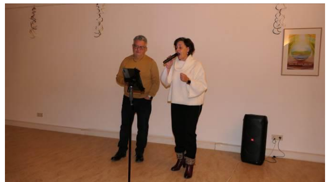
Mc-Musik unterhielt mit einigen Einlagen

Der Abend klang mit vielen Gesprächen und einem guten Miteinander aus. Chr.Z.